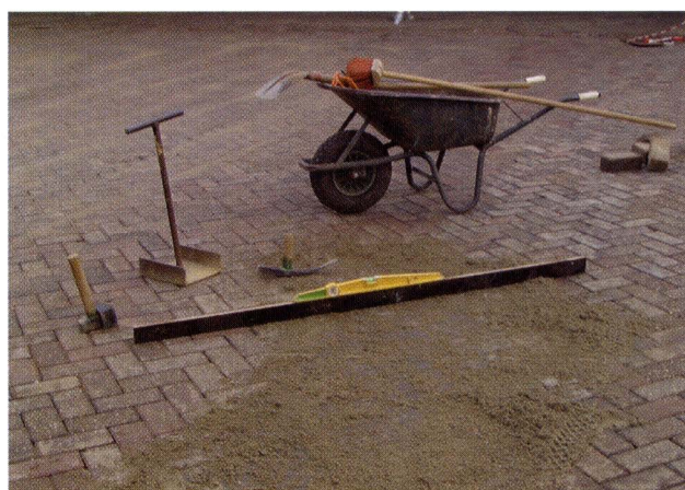
Na reparatie met zand afstrooien en de voegen invegen.