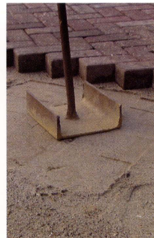
Links: zand bijvullen.